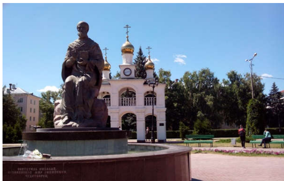
Памятник Николаю Чудотворцу в г. Тольятти (скульптор А.И. Рукавишников)