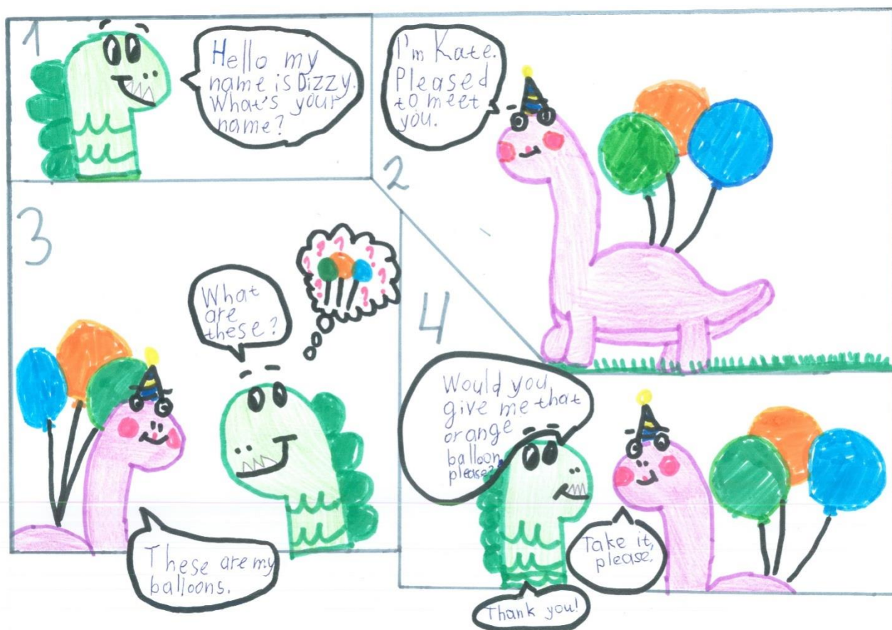
Рис. 1. Наш комикс на английском языке про динозавриков Dizzy и Kate

Комикс нарисовали фломастерами и цветными карандашами, а текст написали на английском языке. Наш комикс про двух динозавриков Dizzy и Kate. Динозавры знакомятся на английском языке, затем Dizzy спрашивает у Kate оранжевый шарик. Затем Kate даёт Dizzy шарик. Динозаврик Dizzy счастлив и благодарит Kate.