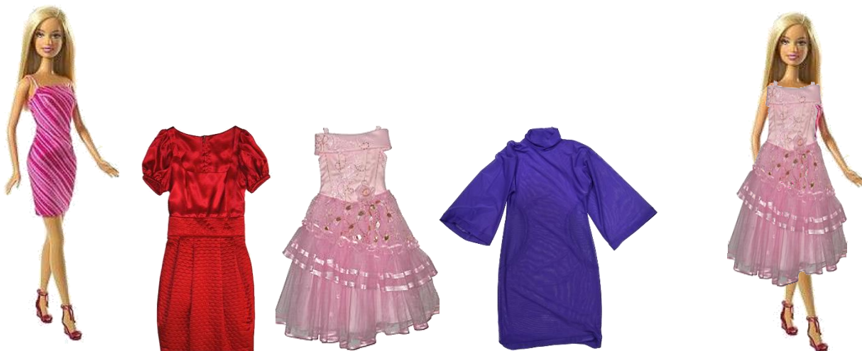
Рис. 1. Наш пример виртуальной примерочной

В качестве примера виртуальной примерочной, мы попробовали в презентации PowerPoint наложить макет куклы Барби на различные фасоны платьев, в соответствии с размером и подобрать подходящие наряды.