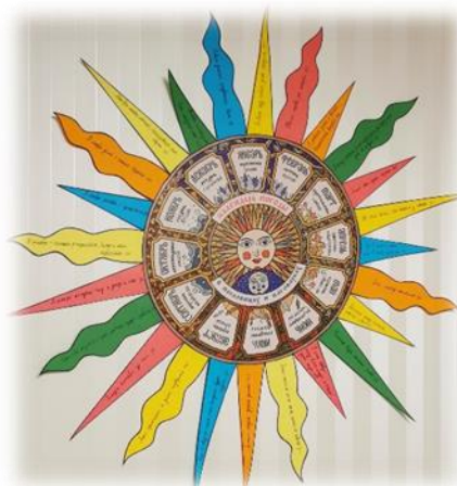
Рис. 1. Календарь погоды в пословицах и поговорках народов Поволжья

В ходе исследования было изучено достаточное количество пословиц и поговорок двух народов [2, 3]. Пословицы представлены на двух языках – русском и татарском. Проведен сравнительный анализ. Проведен сравнительный анализ. Составлен календарь погоды (рис.1). Цель исследовательской работы достигнута.