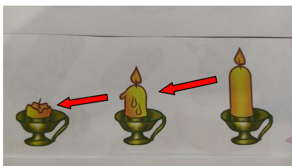
3. Горение свечи.