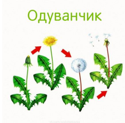
1. Цветение одуванчика